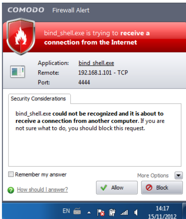
Figura 1 – Comodo Firewall mostra a conexão.

Porém, quando é feita a conexão, o firewall do Comodo avisa ao usuário que há conexões sendo realizadas para a sua máquina, conforme ilustra a figura 1