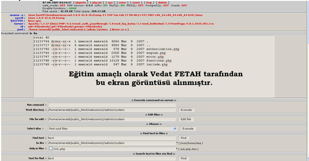
Şekil 2. Sunucuya ilk erişim

neler yapılacağı farklı bir yol izlenerek bulunmuştur. Örneğimizde herhangi bir derlenmiş exploit sisteme wget vasıtasıyla yüklendi ve çalıştırma denemesi yapıldı. Sonuç: başarılı. Daha sonra web kullanıcısının dizinleri altındaki konfigürasyon dosyalarından birisi ile mysql şifreleri okunup sistemin veritabanı vasıtasıyla sql injection yöntemi kullanılarak post metoduyla sunucuya haberler ve dökümanlar eklendi. Örnek için aşağıdaki resime bakabilirsiniz. Sisteme sızdıktan sonra herşey sizin yetenek ve yaratıcılığınıza kalıyor.